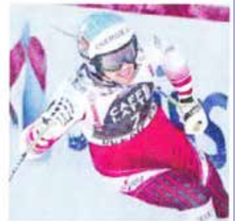
Spektakulär Den vierten Weltcup-sieg in seiner alpinen Ski-karriere feierte Vincent Kriechmayr in Wengen. Nun wartet die Streif auf den Gramastettner. Seite 44