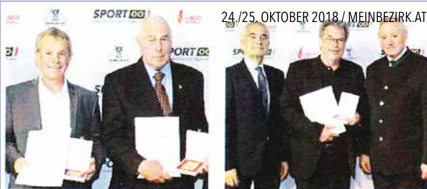
Konsulenten: Pocessny und Oeller (v. l.).